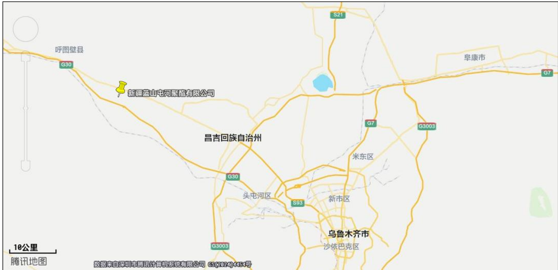
图 3-1 建设项目地理位置示意图