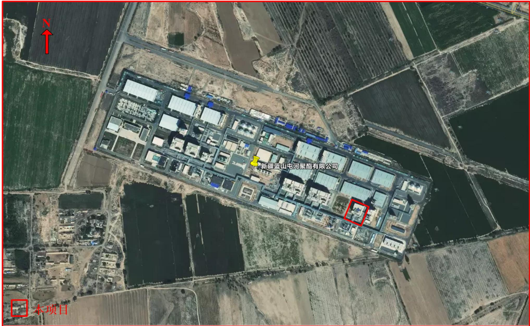
图 3-2 本项目及厂区示意图