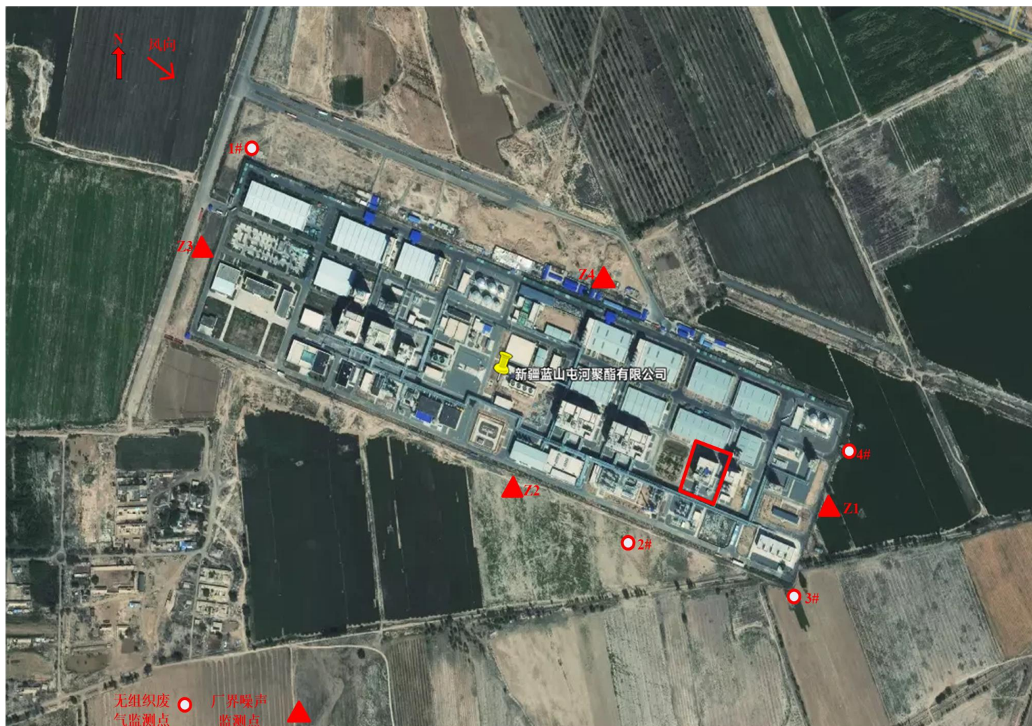
图 7-1 厂界无组织废气、噪声监测点位图